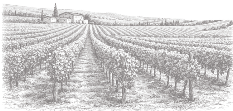
Domaine de Chiroulet, Larroque-sur-l'Osse (32)